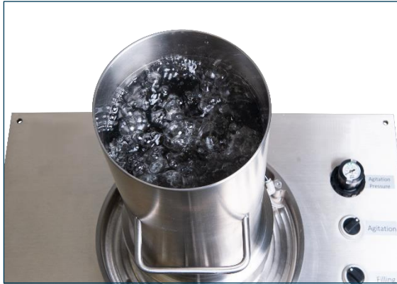
Bewirbeln - pneumatisches Modell