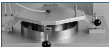
Pneumatic couching device (optional)