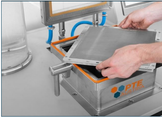
Austauschen des Siebes