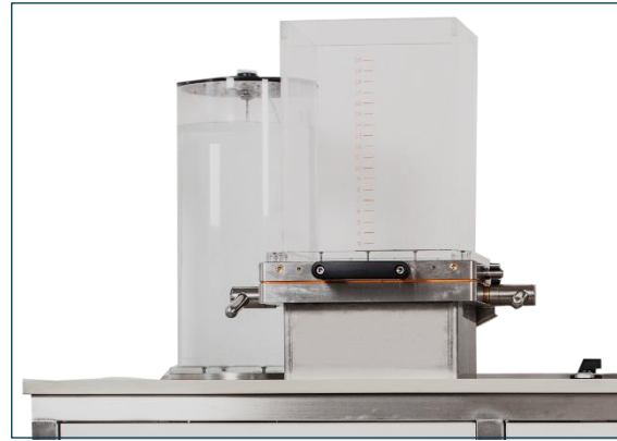
Weißwassertank (links) & Formersäule (rechts)