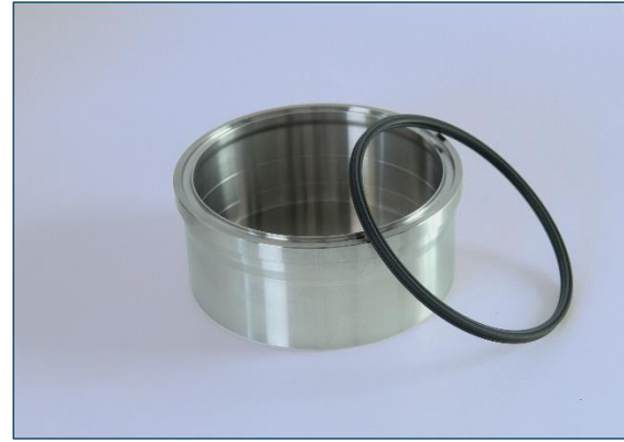
verschiedene Größen des Testbereichs erhältlich