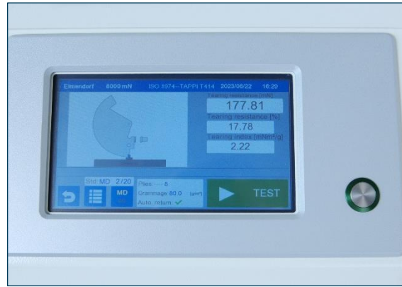
Obsługa za pomocą ekranu dotykowego