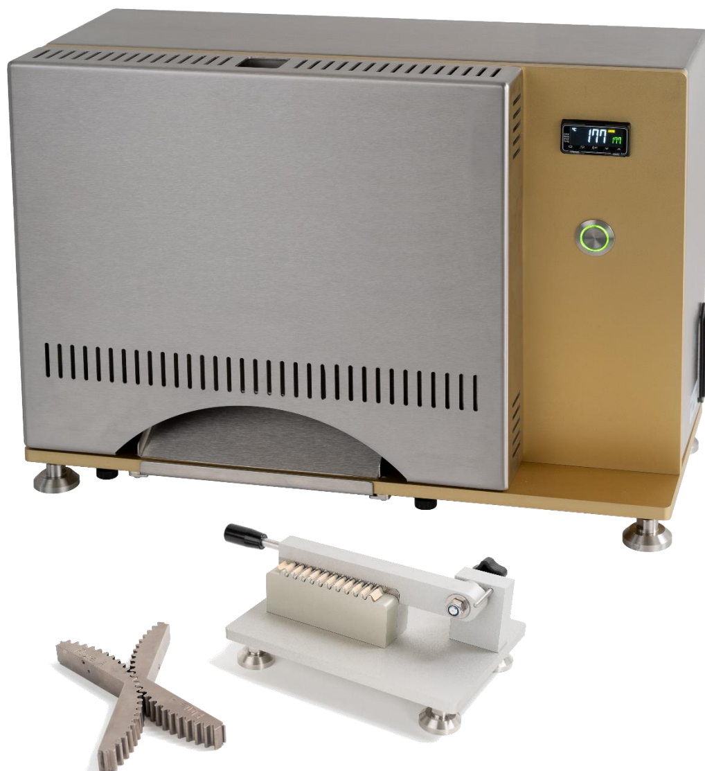
Segment i „trzecia ręka”