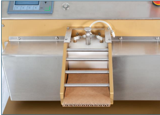
Uchwyt na próbki z blokiem mocującym